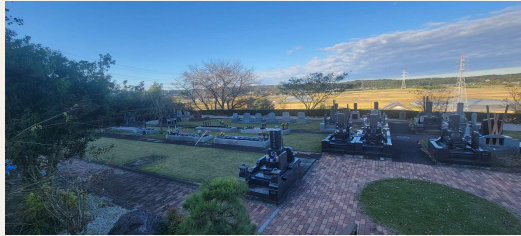
田園を見渡す悠久の大地 寺の台遺跡(現圓明院境内) 8,000年前(早期縄文時代)